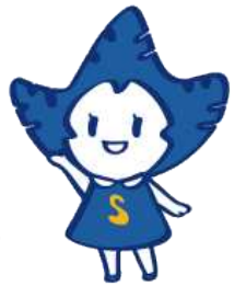
우리 대학 마스코트 '눈송이'